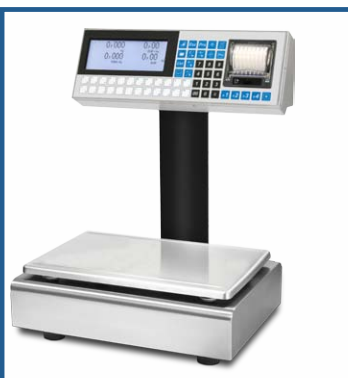
Balances pour les magasins

La gamme des produits Helmac comprend aussi :