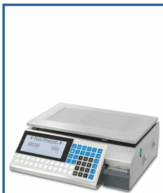
Balances pour l'étiquetage et les produits préemballés