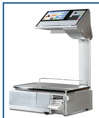
Balances poids-prix avec écran à couleur